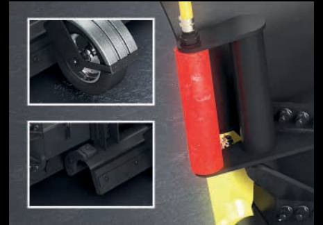
Kattavasti varusteltavissa tarpeesi mukaan