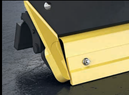
Siiven päitä suojaavat vaihdettavat kulutuspalat