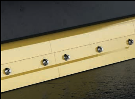
Moniosainen AM iFLEX™ joustoterä rakenne