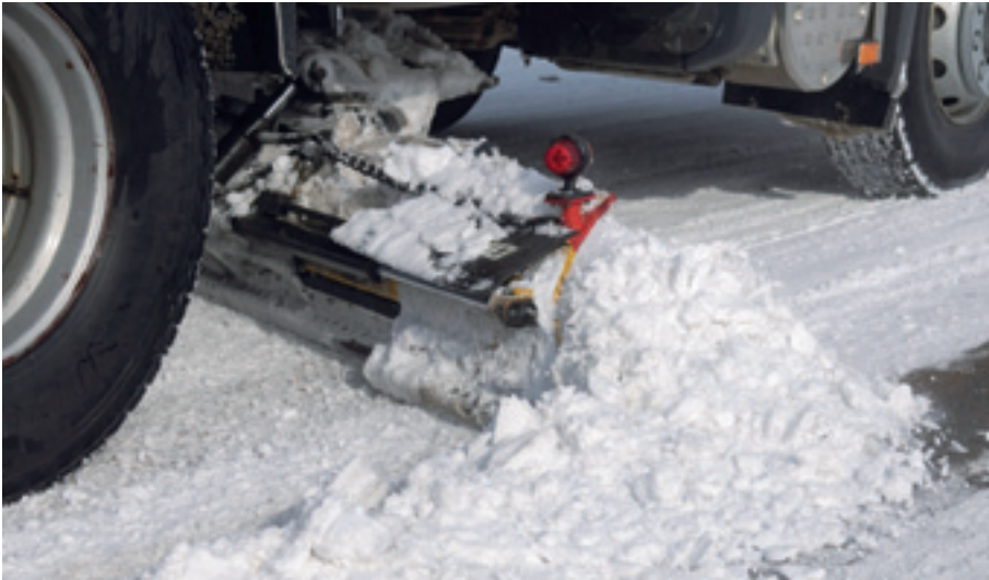
Osa kuvista sis. lisävarusteita.

AM 5 HD 2 alusterässä on säädettävä aurasukulma, AM 6 ja AM 4/3 alusterässä puolestaan kiinteä aurasukulma. Alusterällä tien kaltevuuden muokkaus käy vaivattomasti molemmalle puolelle. Terän painatusvoima välittyy koko teräosalle tasaisesti ja teräkulman säädöllä saadaan kulutusterien parhaat ominaisuudet käyttöön. Vakiona alusterässä on työleveyttä lisäävät hydrauliset jatkosiivet vasemmalle ja oikealle. Alusterän liikkeille on oma venttiilistö, jota hallitaan ohjaamoon sijoitetun Ergo-ohjaimen avulla. Alusterä ja sitä ohjaavat laitteet on varustettu useilla käyttöturvallisuutta parantavilla teknisillä ratkaisuilla.