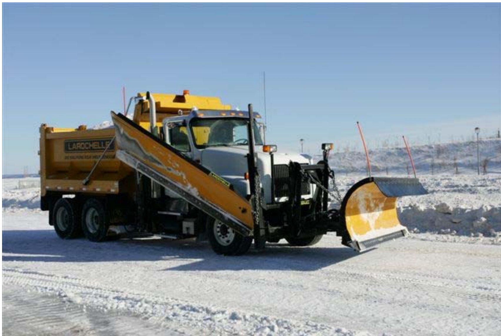
Kanadalainen tienhoitoauto esittelyssä työnäytöksessä.