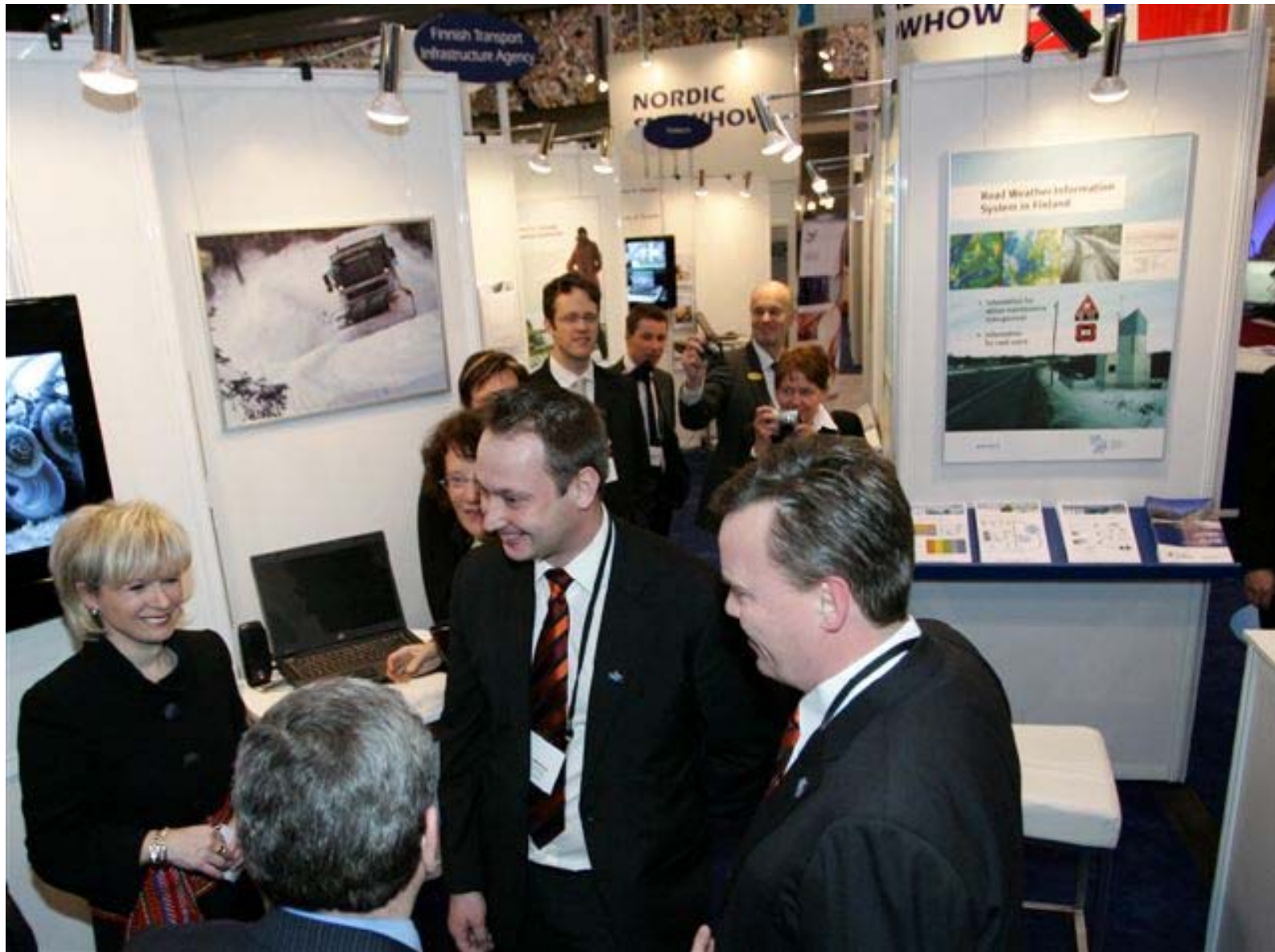
Arctic Machine sai hyvää näkyvyyttä osallistuessaan PIARCin maailmannäyttelyyn Kanadan Québecissa 8. – 11. helmikuuta 2010. Osastolla vierailivat näyttelyvieraiden ja seminaariosallistujien ohella Kanadan liikenneministeri Julie Boulet (vas.) sekä Québecin kaupunginjohtaja Regis Labeaume.